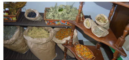
Ponuda kompanije obuhvata izbor biljnih čajeva, proizvode na bazi biljaka za zdrav život, kao što su domaće jabukovo sirće ili biljne kreme.